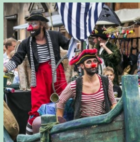
godz. 14.15 Teatr Kubika