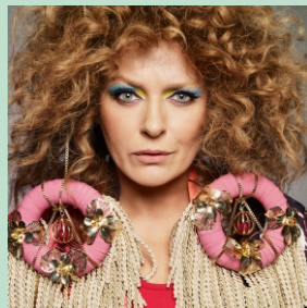
godz. 20.30 NOSOWSKA