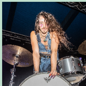
godz. 18.30 Michał Szpak