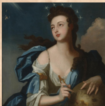
muza astronomii i geometrii