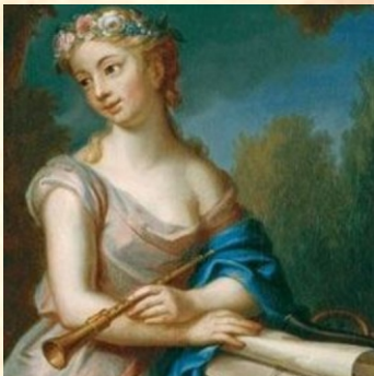
muza poezji lirycznej i gry na flecie