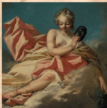
muza tragedii i śpiewu