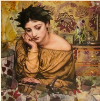
muza poezji miłosnej