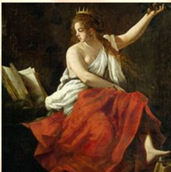
muza poezji epickiej, filozofii i retoryki