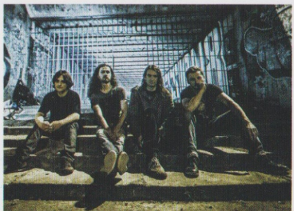
ART OF ILLUSION