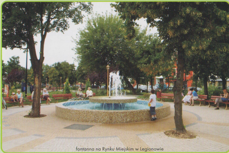
fontanna na Rynku Miejskim w Legionowie

tekst przygotowany przez wydział marketingu UM Legionowo